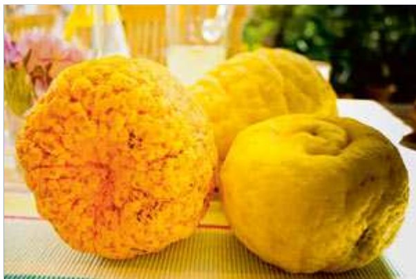
Citrus aurantium (Bizzaria di Mentone, galt lange als ausgestorben) und Citrus medica pompia (die prachtvolle römische Zitronat-Zitronen)