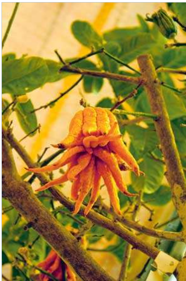
Citrus medica digitata (Buddhas Hand, eine der ersten Zitronen überhaupt)